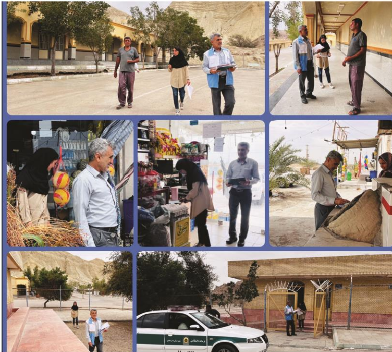
صدور ۱۲ خطاریه و معدوم سازی بیش از بیست کیلو گرم در طرح تشدید نظارتی سلامت نوروزی

حساس از جمله رستوران ها، هتل ها، مراکز اقامتی، اماکن بین راهی، سامانه های آبرسانی و مراکز تهیه و عرضه مواد غذایی از جمله مواردی است که در این ایام به دلیل افزایش سفرهای نوروزی با حساسیت بیشتری مورد بازدید بازرسی بهداشت محیط قرار خواهد گرفت.