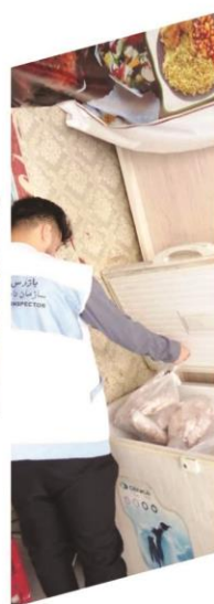
شهر بندر خمیر

بازدید مسئول واحد سلامت محیط و کار شبکه بهداشت و درمان بندر خمیر به همراه بازرسین دامپزشکی از رستورانهای سطح شهر بندر خمیر